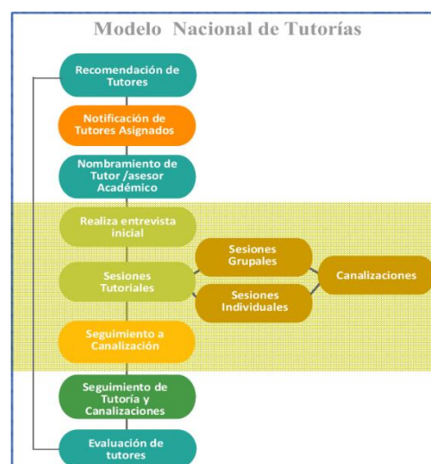
Figura 2 Plan Institucional de Tutoría

Para lograr el acompañamiento estudiantil se establecen: el programa institucional de tutorías y el plan de acción de tutorial, donde se muestran los ejes rectores, actores involucrados y los roles establecidos para lograr la consolidación.