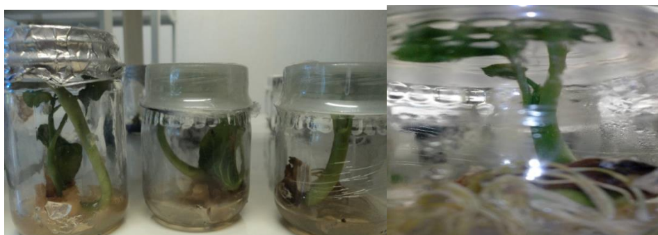
Figura 12.2 Plántulas de Jatropha curcas después de dos meses de haber sido obtenidas in vitro

Muñoz et al., (2003) obtuvo plántulas de Jatropha curcas con crecimiento normal y raíces delgadas y largas sin adicionar reguladores de crecimiento utilizando medio de cultivo MS.