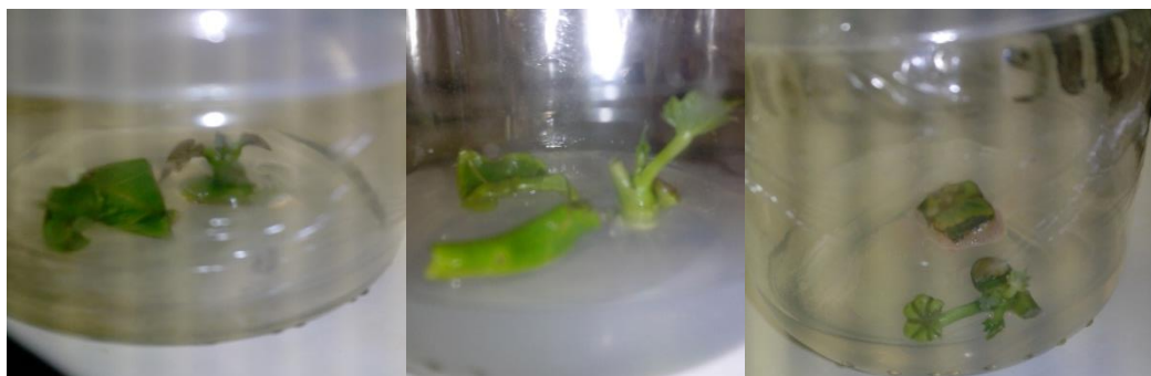
Figura 12.1 Brotes obtenidos de tallos con un nudo de Jatropha curcas

Publicaciones como las de Datta y col. (2007) reportaron la inducción de brotes a partir de nodales de J. curcas a los 28-42 días de incubación, de igual forma que Banerjee y Shrivastava (2008) obtuvieron brotes con el mismo material vegetal a los 21-28 días de cultivo, utilizando AIB y BAP en concentraciones mas altas que en está investigación, además de otros aditivos como sulfato adenina, glutamina y acido cítrico.