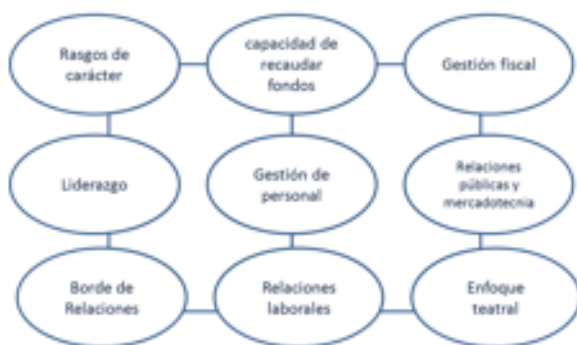
Figura 1 Fuente elaboración propia: basada en los 9 rasgos gerenciales de Rhine