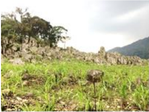
Imagen 3 Mirador paisaje de las rocas Autor: Amayrany Merino Contreras (2018)

El estado actual de este mirador en temporada de zafra es limpio y libre de obstáculos que puedan interponerse entre turista y los sembradíos. El acceso libre a pie, en automóvil o autobús. En el lugar se puede realizar observación de flora, fauna, paisajismo, caminata de montaña, ciclismo.