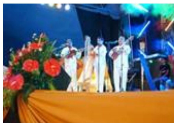
Imagen 8 Fiesta patronal a San Isidro Labrador

Clasificada dentro del tipo Fiestas, sub tipo fiestas patronales, esta celebración en el municipio de Cuichapa es de las más importantes ya que inicia de dos a tres días antes del 15 de mayo, el cual es el día principal. La iglesia en la religión católica celebra con bodas, bautizos y confirmaciones; y por otra parte el H. Ayuntamiento lo celebra con eventos culturales, deportivos y artísticos. La fiesta patronal en honor al Patrono San Isidro Labrador, Santo de los agricultores ha tenido una continuidad de más de 60 años sin ser interrumpida.