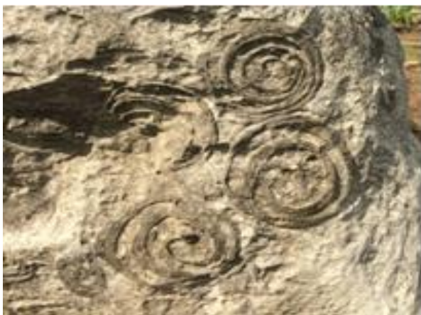
Imagen 4 Museo natural de fósiles. Autor: Amayrany Merino Contreras (2018)

Se trata de un lugar paleontológico natural que, debido al relieve inclinado, se colocan piedras a manera de exhibición donde se pueden observar especies de fósiles de organismos vivientes hace miles de años y que quedaron petrificados en las piedras de cantera y lajas que hay en la zona. El paisaje del Río Blanco, las montañas y el color blanco de las piedras hacen de este un excelente lugar para caminar y realizar tomas fotográficas desde distintos ángulos. El estado actual de estos fósiles es limpio, y en las fechas de cosecha se puede apreciar una mejor vista. El acceso es libre a este recurso es a pie, en automóvil o autobús y puede ser visitado generalmente entre los meses de noviembre a mayo.