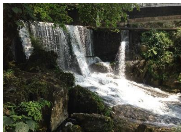
Imagen 2 Cascada de Siete Aguas

Sitio natural que junto con el sótano conforma el lugar conocido como Siete Aguas. La cascada, es una caída de agua superficial de cuatro metros, producto de la presa que se construyó con la finalidad de aprovechar el agua que brota del sótano para consumo humano. Es visitada por turistas regionales y nacionales principalmente en temporada vacacional, generalmente en verano. Su acceso es a pie. En el lugar se pueden realizar diversas actividades de ecoturismo como observación de flora y fauna e recreativas ya que la cascada genera un afluente que es mucho del gusto de los visitantes.