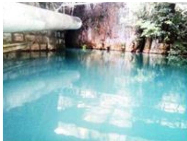
Imagen 1 Sótano de siete aguas

Sitio natural ubicado en el manantial siete aguas, el cual es producto de un nacimiento de agua de corriente subterránea ya que proviene del subsuelo, provocando una gran poza, misma que desemboca en la cascada del manantial. Su acceso es a pie, se ha tenido la visita de turistas nacionales, sin embargo, el tipo de turismo que prevalece es de los municipios cercanos. La temporada en la que recibe más turistas es en vacaciones de semana santa y verano. El lugar carece de equipamiento turístico e infraestructura, sin embargo, los trabajos de limpieza y vigía son desarrollados por el H. Ayuntamiento Constitucional. Este nacimiento ha tenido diferentes usos. En 1930, era utilizado para abastecer de agua al ferrocarril y a su personal, la vía sigue estando a 10 metros de su afluente. Años después, comenzó a proporcionar el vital líquido a muchas comunidades e incluso otros municipios. Esto marcaría el inicio de los primeros sistemas pluviales en la zona.