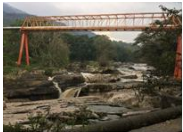
Imagen 5 Cascada del río blanco. Autor: Amayrany Merino Contreras (2018)

Este lugar se encuentra sobre la carretera que va hacia el municipio de Cuichapa, se puede apreciar la caída de agua sobre las rocas debajo un pequeño puente de paso. Se pueden desarrollar actividades como observación de flora y fauna, escenario de fotografías y caminata. El acceso es libre y puede ser a pie, en automóvil o autobús. Al ser un punto de conexión entre dos municipios, se puede visitar en cualquier época del año aun cuando se recomienda entre los meses de noviembre a mayo.