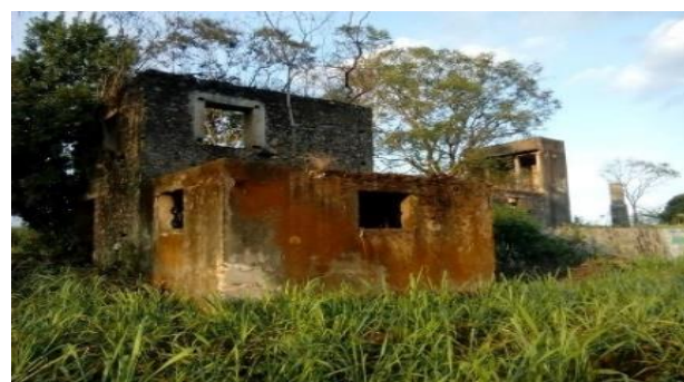
Imagen 9 Trapiche de Santa Inés

Fue uno de los primeros trapiches en el estado de Veracruz, propiedad de familia española, el trapiche de Santa Inés, está ubicado en la localidad llamada por mismo nombre puesto que esa familia tenía devoción en una santa llamada Santa Inés. Se puede observar que dentro de una de las habitaciones aún existe un tanque de los cuales se utilizaba para el proceso de la miel de caña. El acceso es libre y se puede llegar a pie, en automóvil o autobús. Se pueden realizar actividades al aire libre mientras se aprecia su construcción.