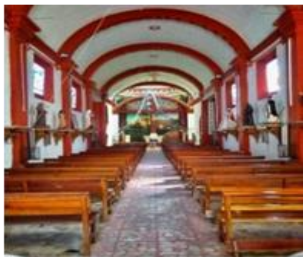
Imagen 7 Iglesia de San Isidro Labrador

Sitio ubicado dentro de la clasificación de arquitectura y espacios urbanos. Es el centro ceremonial católico en el que se ha congregado gran parte de la población de esta ciudad. Su nombre hace alusión al San Isidro Labrador. Su estilo arquitectónico clásico y las grandes paredes de esta iglesia hacen que resalte en el medio de la zona de las altas montañas. El acceso puede ser a pie o en automóvil, en el lugar se puede apreciar la arquitectura y cuenta con una oficina de información.